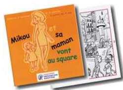
Mikou et sa maman vont au square Cycle 1

Parmi les supports dédiés aux enfants de maternelle et primaire, trois sont consacrés au piéton. L'objectif est de préparer les enfants à devenir des piétons autonomes, capables de circuler à pied en sécurité.