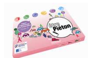
Etre Piéton Cycle 3

Mais les enseignants ne sont pas le seul public visé par les associations Prévention Routière et Assureurs Prévention. Les parents ont également un rôle primordial à jouer dans l'éducation routière des plus jeunes. C'est pourquoi elles ont créé en 2006 le site priorite-vos-enfants.fr , sur lequel les parents pouvaient trouver des conseils pratiques pour éduquer leurs enfants à la route, mais aussi des avis d'experts, des jeux pour les petits... L'ensemble de ses contenus a aujourd'hui été réintégré sur les sites preventionroutiere.asso.fr (rubrique "Parents") et assureurs-prevention.fr .