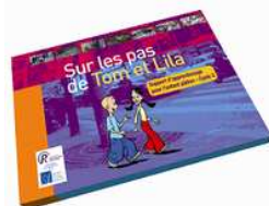
Sur les Pas de Tom et Lila Cycle 2